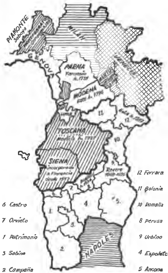
Los Estados de la Iglesia y los Principados italianos.