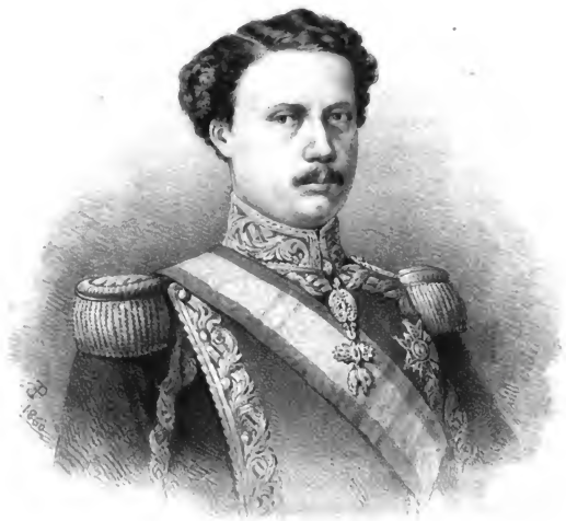
S. M. EL REY D. FRANCISCO DE ASIS.