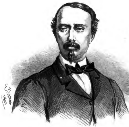
La. L. de C. Montemolin 5