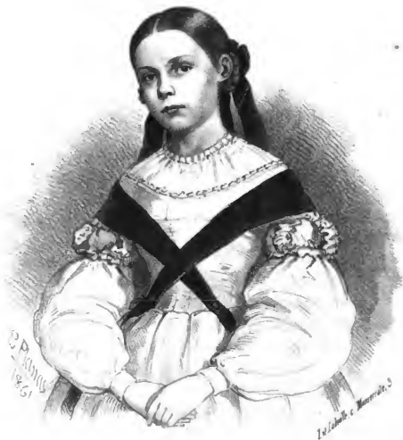
S. A. R. LA SEÑAL. SRA. INFANTA DE MARIA ISABEL