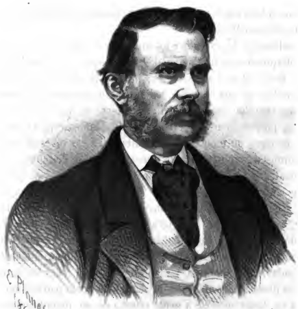
NARCISO MONTURIOL El inventor del Yelmeo.