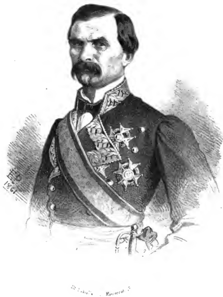
EL GENERAL D. DOMINGO DULCE.