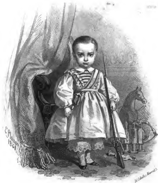
S. A. R. EL SRMO. SR. PRINCIPE DE ASTURIAS