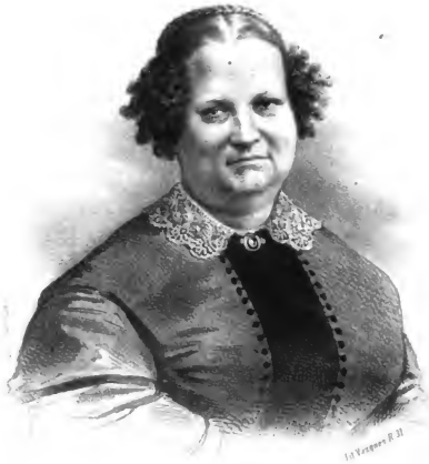
S. M. DE MARIA CRISTINA DE BORBON.