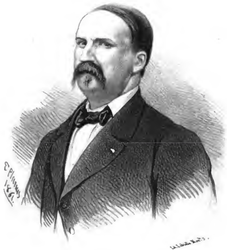
S. A. R. ANTONIO DE ORLEANS Duke de Montpensier.