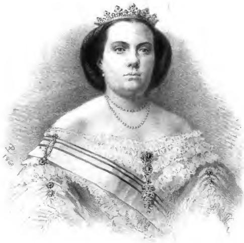
S. M. LA REINA DE ISABEL 2ª