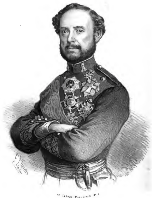
EXMO. S. RO D. JUAN PRIM Conde de Reus, Marques de Castillejos.