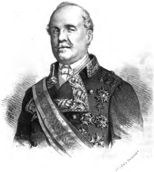
EL PRIMER DUQUE DE TETUAN.