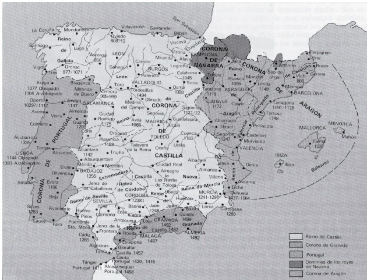
España en el siglo XV.

Entretanto los reyes recibían en audiencia a los tres hombres de capuchas pardas procedentes de Oriente y Occidente. Los dos que venían de Jerusalén eran frailes franciscanos enviados por el Sultán de Egipto para advertirles que, si no cesaban en su lucha contra los musulmanes españoles, él pasaría por la espada a todos los cristianos residentes en Palestina y destruiría sus iglesias y la iglesia del Santo Sepulcro de Jerusalén. Isabel recibió a los frailes con gran amabilidad, les concedió un donativo de mil ducados para su convento y les mandó regresar con un precioso bordado, obra de sus propias manos, para que fuera expuesto en la iglesia del Santo Sepulcro. También les encargó que comunicaran al Sultán que enviaría en breve un embajador para tratar en mayor profundidad la cuestión planteada. De este modo intentaba ganar algún tiempo; y, en el momento oportuno, envió a Pedro Mártir para firmar un tratado con él.