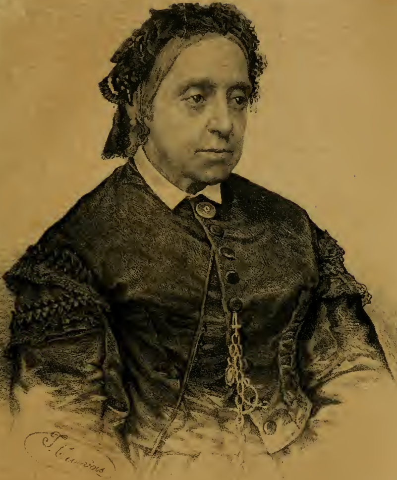
Maria Teresa de Braganza y Borbon L