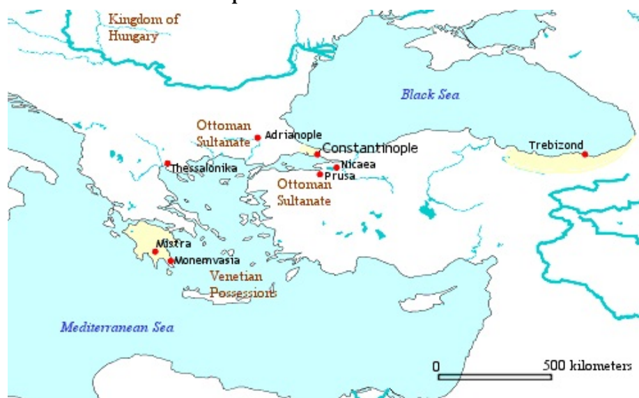
Imperio bizantino año 1453