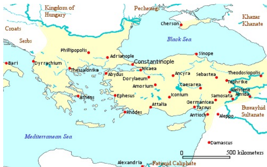
Imperio bizantino año 1025