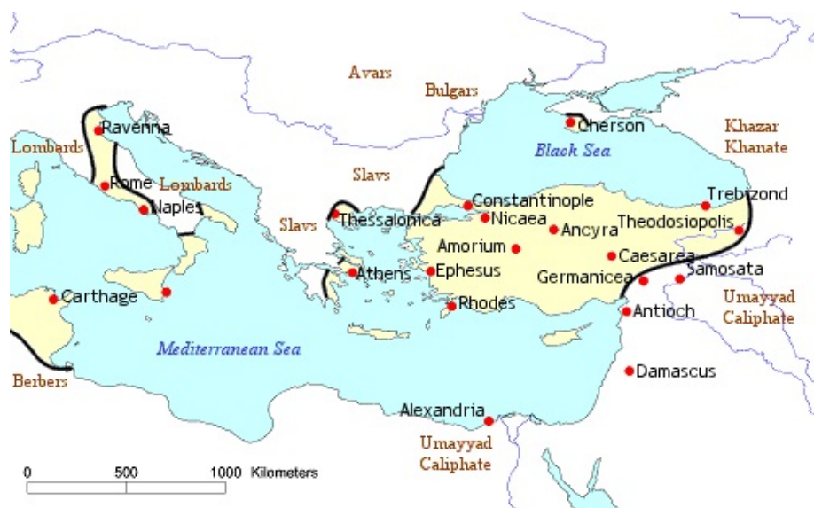
Imperio bizantino año 668