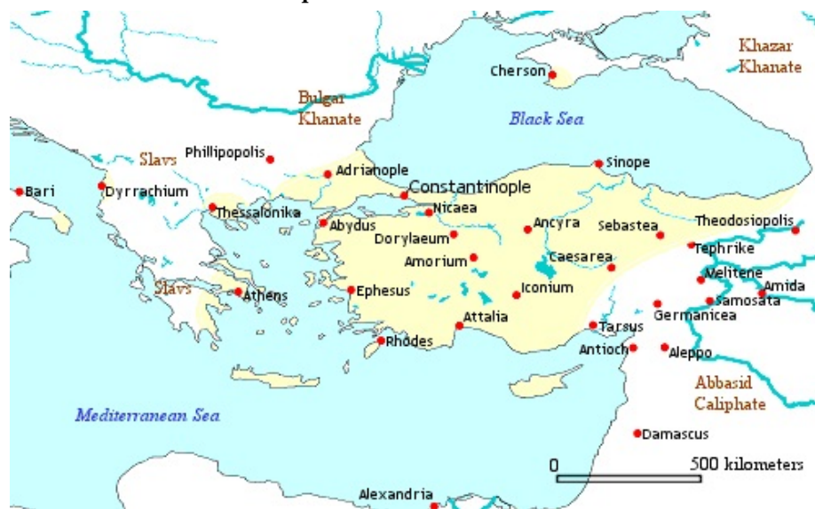
Imperio bizantino año 780