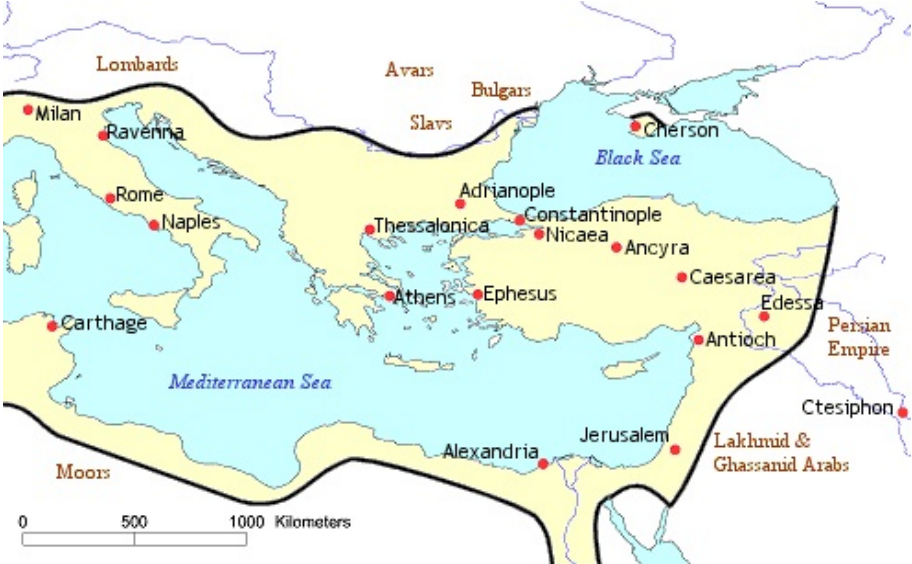
Imperio bizantino año 565