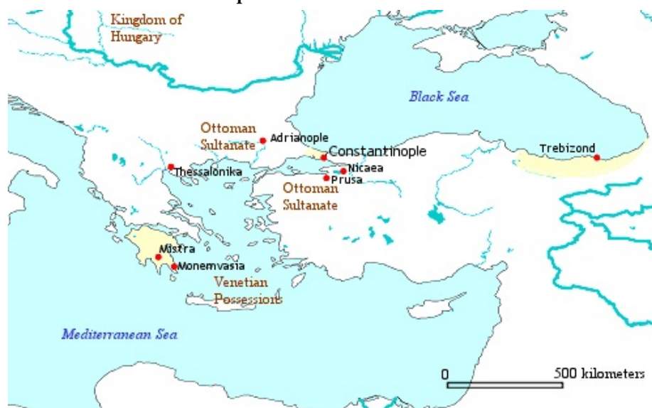
Imperio bizantino año 1453