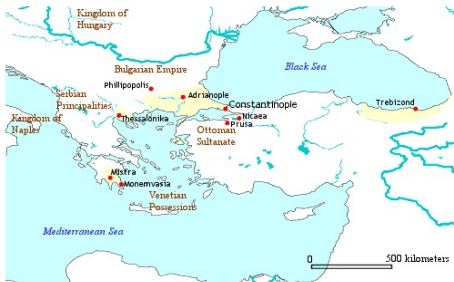
Imperio bizantino año 1350