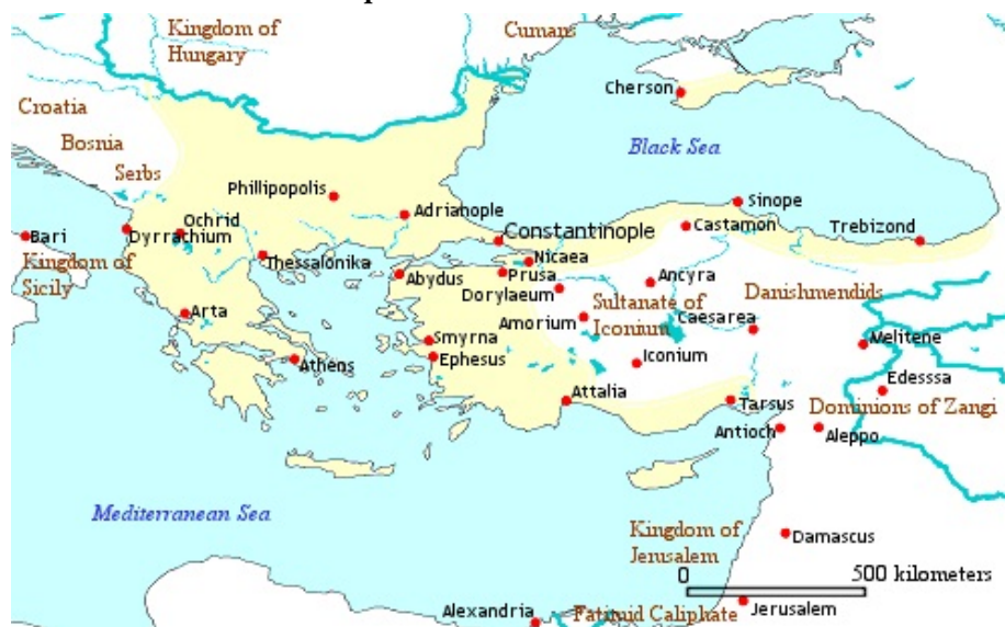
Imperio bizantino año 1143