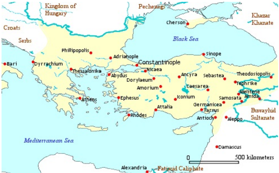
Imperio bizantino año 1025