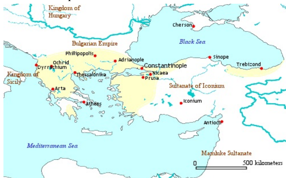
Imperio bizantino año 1278