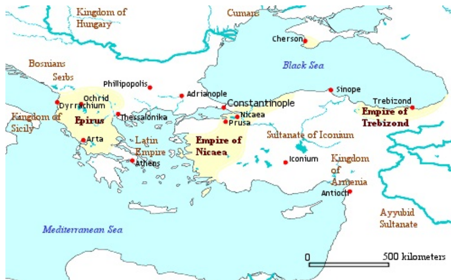
Imperio bizantino. Estados sucesores año 1218