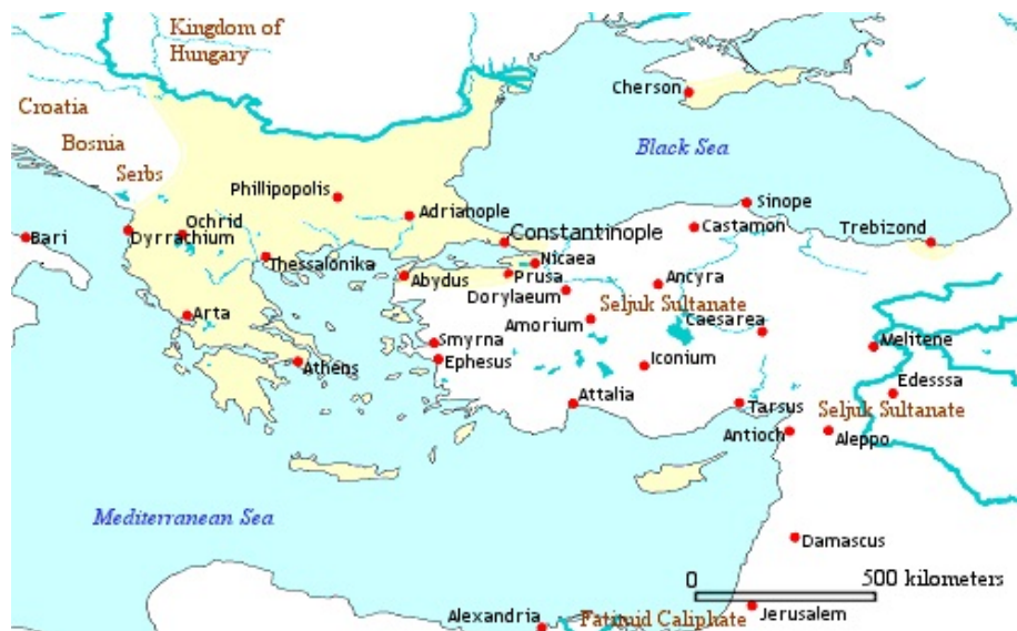
Imperio bizantino año 1092