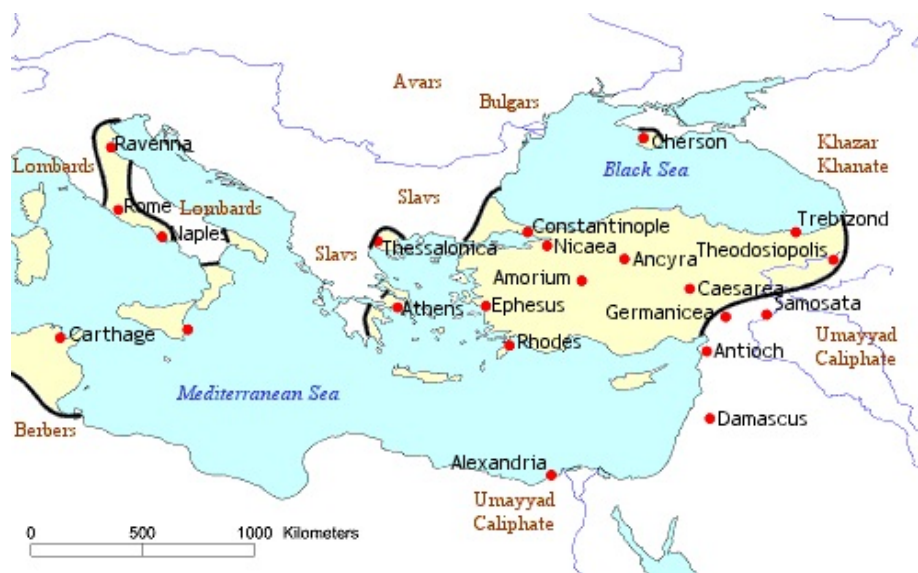
Imperio bizantino año 668