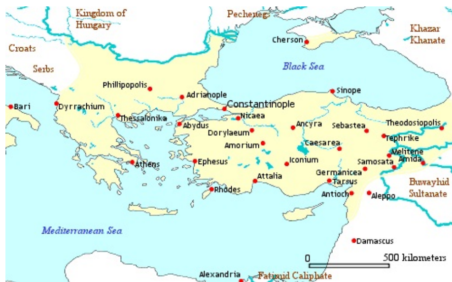
Imperio bizantino año 1025