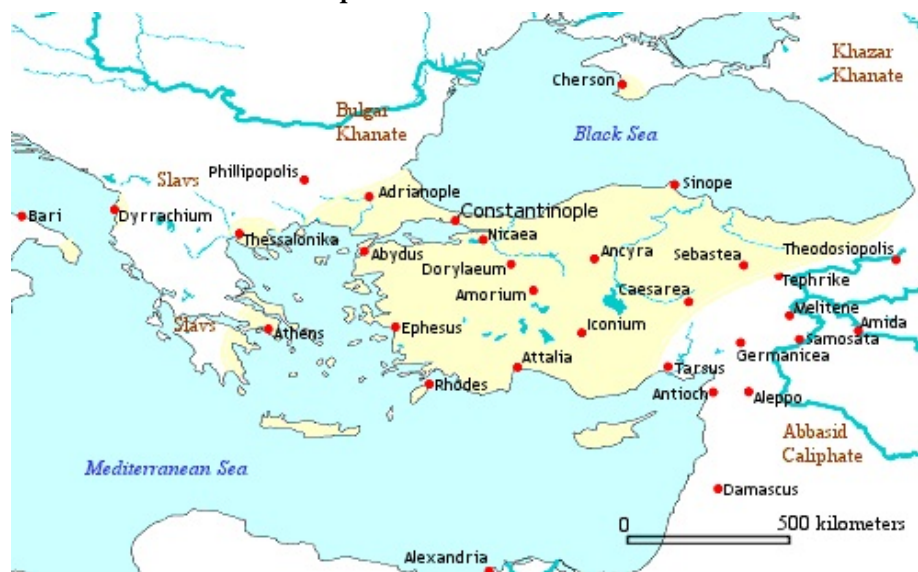
Imperio bizantino año 780