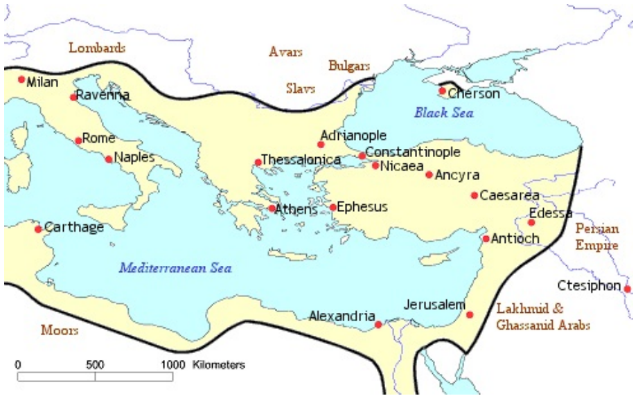
Imperio bizantino año 565