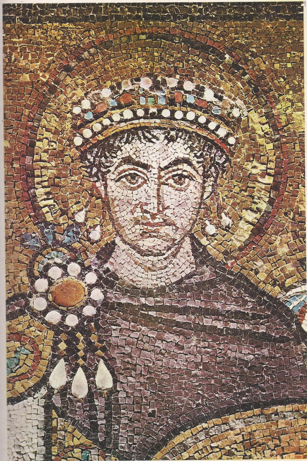
1. Justiniano, detalle del mosaico de la iglesia de San Vitale de Rávena.