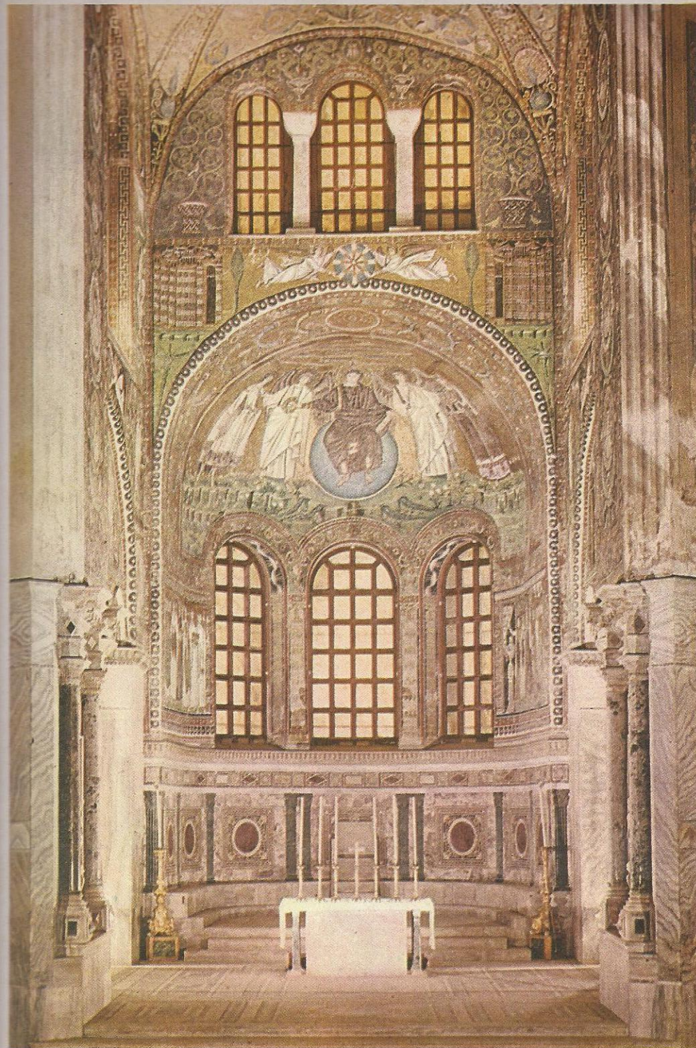
1. El interior del ábside de San Vitale de Rávena (Scala).