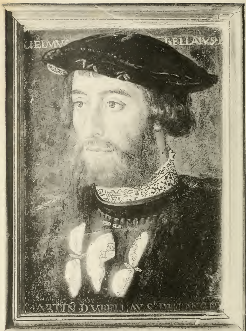
PORTRAIT DE GUILLAUME DU BELLAY (Musée de Versailles)