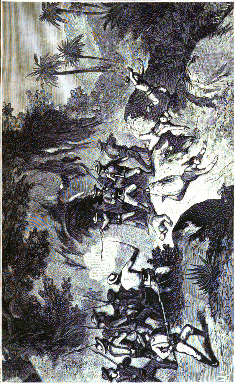
Los insurrectos son sorprendidos en una cueva.