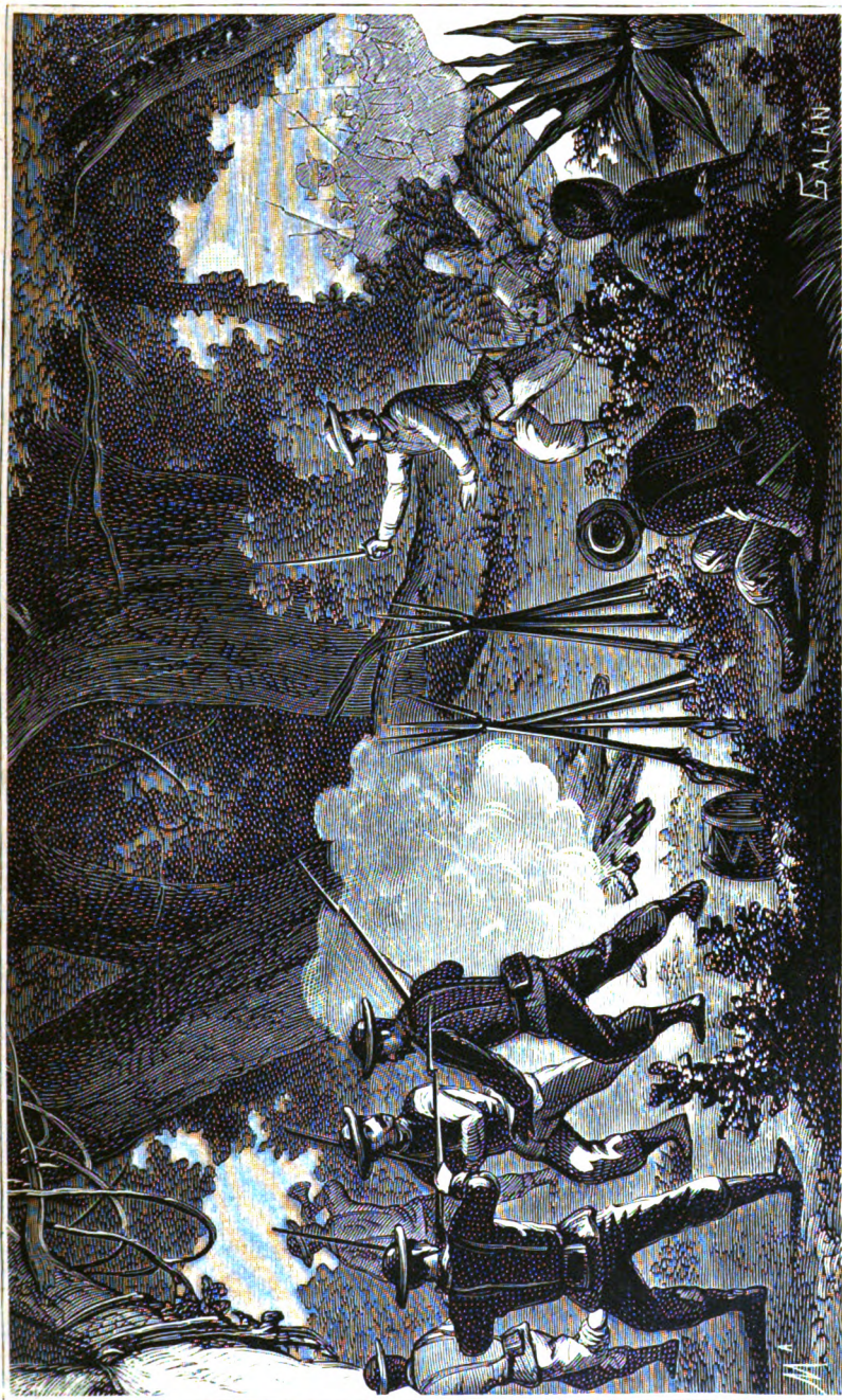
Campamento insurrecto sorprendido por los defensores de España.