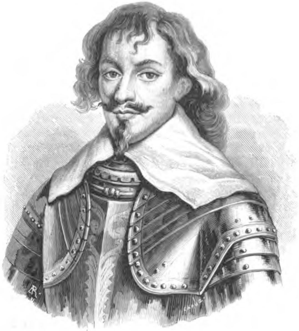
EL CONDE DE WARWICK

Ambos ejércitos pasaron la noche en el campo de batalla, ambos inquietos por el día siguiente y atribuyéndose la victoria. El parlamento había perdido más soldados, y el rey más oficiales y jefes distinguidos. Al amanecer Carlos recorrió su campamento; faltaba un tercio de infantería y muchos caballeros, no porque hubiesen perecido todos, sino porque el frío, la falta de víveres y el terror del primer choque habían dispersado a muchos voluntarios. Para continuar libremente su camino sobre Londres, quería el rey trabar una nueva refriega; pero pronto conoció que era excusado intentarlo. Agitábase la misma cuestión en el campo enemigo; Hampden,