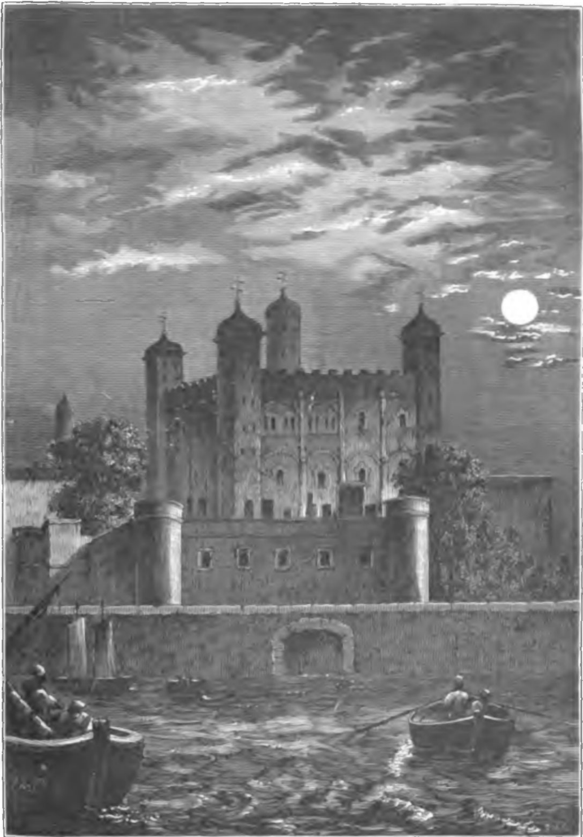
LA TORRE DE LONDRES