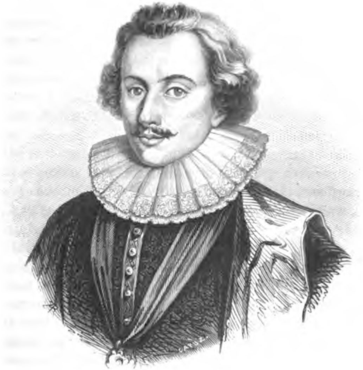
EL DUQUE DE BUCKINGHAM

Proclamada ésta en Inglaterra por un déspota, empezó siendo tiránica; y no bien hubo aparecido, cuando persiguió como enemigos a sus mismos partidarios. Enrique VIII levantó con una mano cadalsos para los católicos, y con la otra, hogueras para los protestantes que se negaban a someterse al símbolo, y no aprobaban el gobierno que de él recibía la nueva Iglesia.