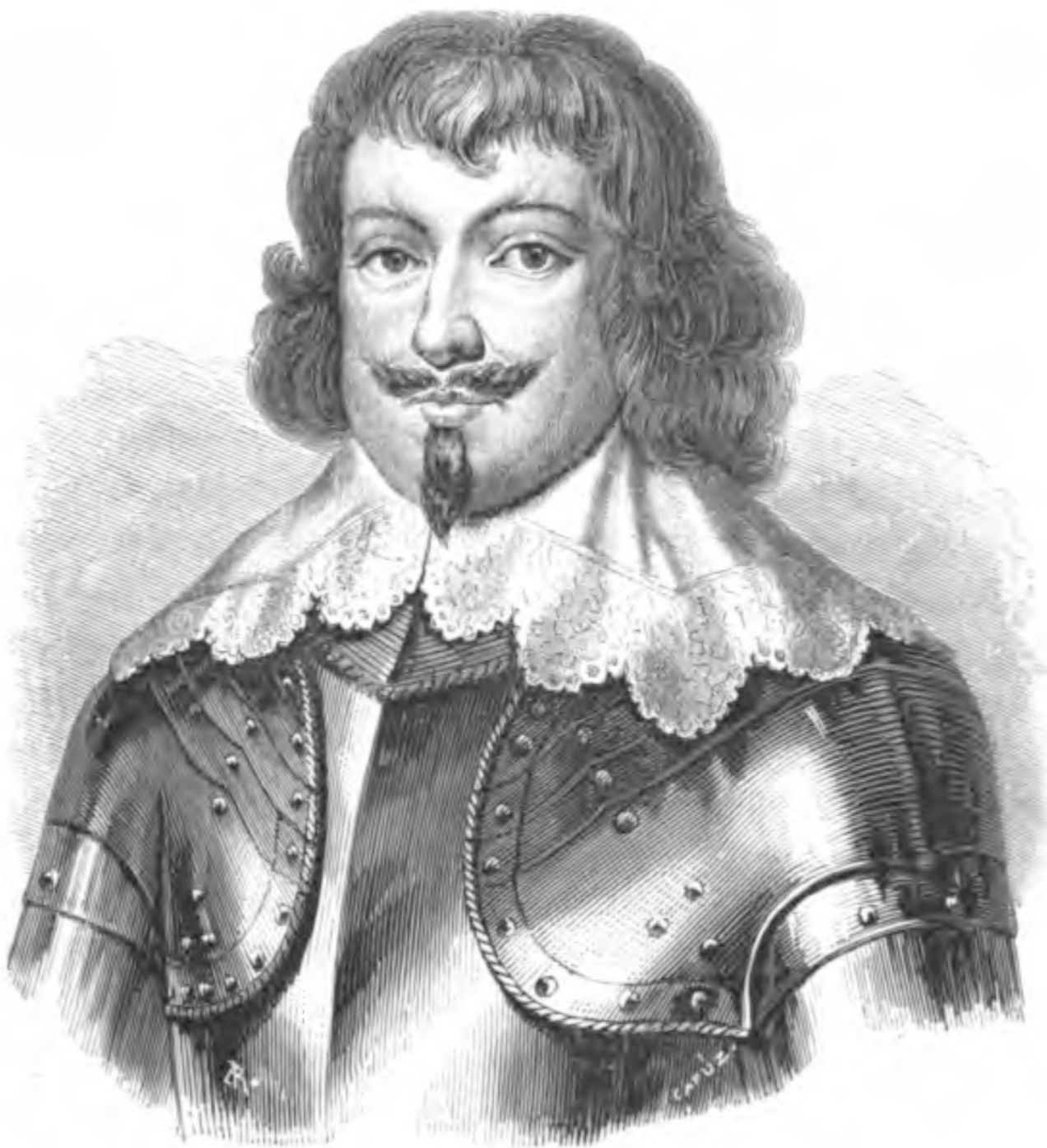
EL CONDE DE ESSEX

de Inglaterra. Entre los debates de ambos partidos en el seno del parlamento, y su choque a mano armada en los campos de batalla, se interpuso por decirlo así durante algunos meses el raciocinio y la ciencia, suspendiendo el curso de los acontecimientos, desarrollando sus más hábiles esfuerzos para granjearse la libre adhesión de los pueblos, y queriendo dar a una y otra causa el carácter de la legitimidad.