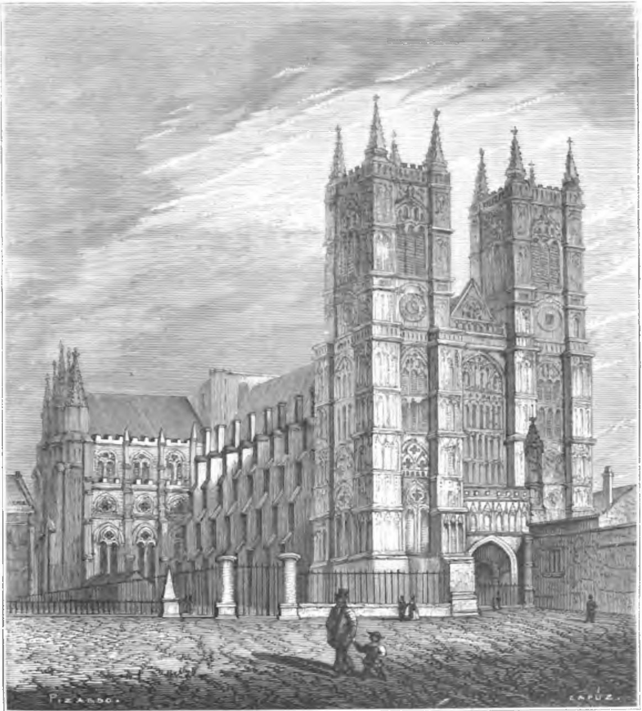
ABADÍA DE WETMINSTER

El rey quedaba solo en Whitehall, perdida la confianza de sus más fieles partidarios. Aun los mismos caballeros se dispersaban intimidados o guardaban silencio. Probó a responder a los municipales, ordenando de nuevo el arresto de los acusados, pero sus contestaciones se habían desacreditado ya, y sus órdenes no tenían efecto. Supo que dentro de dos días abriría la cámara sus sesiones y que los cinco miembros serían conducidos pomposamente a Westminster por las milicias, el pueblo, y aún por los marineros del Támesis, cuya confianza creía poseer: “¡Cómo pues!, dijo con enfado, ¡hasta esos ratones de agua me abandonan!”. Estas palabras