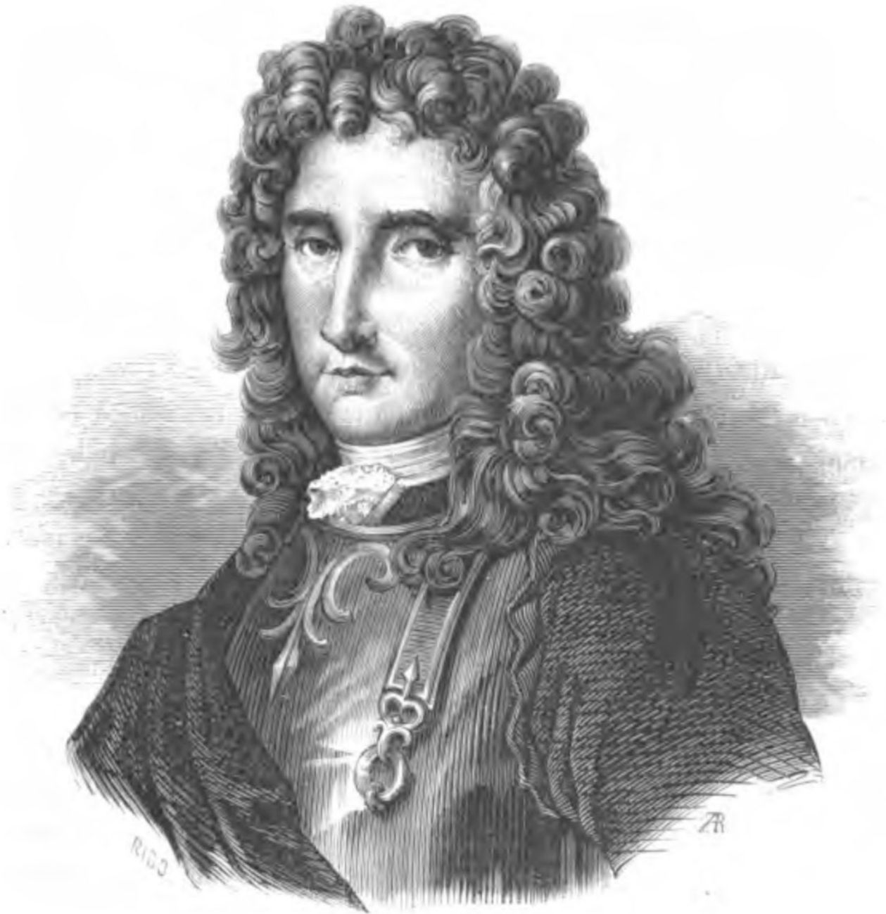
EL DUQUE DE HAMILTON