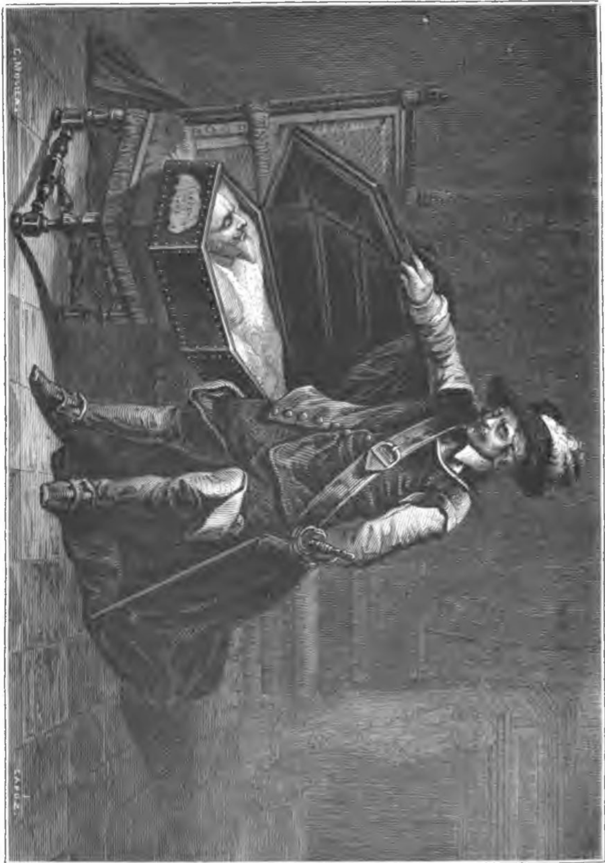
CROMWELL MIRANDO ATENTAMENTE EL CADÁVER DE CARLOS I

Juxon: Si señor, sólo hay un paso que dar; está lleno de turbación y agonía, pero es breve y pensad que ganáis mucho con él; os hace pasar de la tierra al cielo.