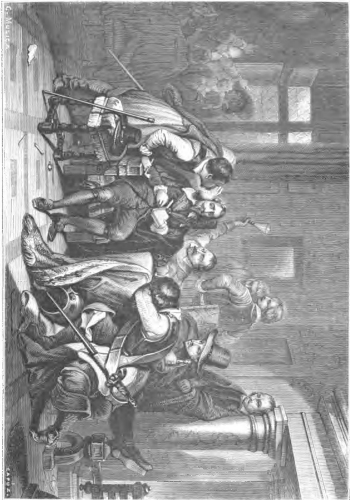
INSULTOS PRODIGADOS A CARLOS I

Carlos apareció vencido y sólo insistió débilmente: