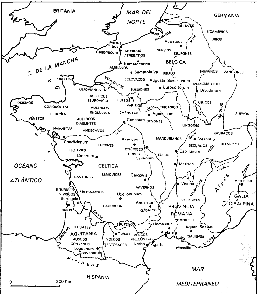
3. Pueblos de la Galia