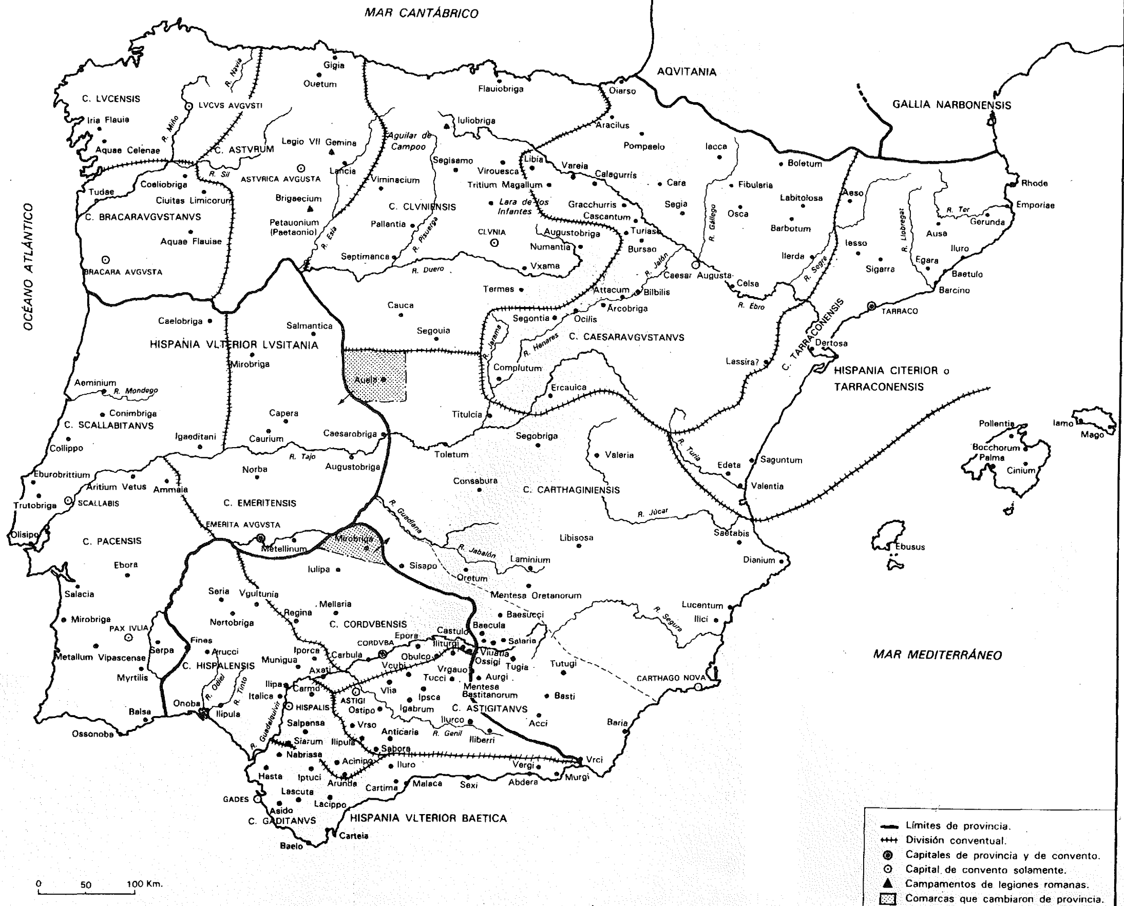
2. Hispania. División administrativa