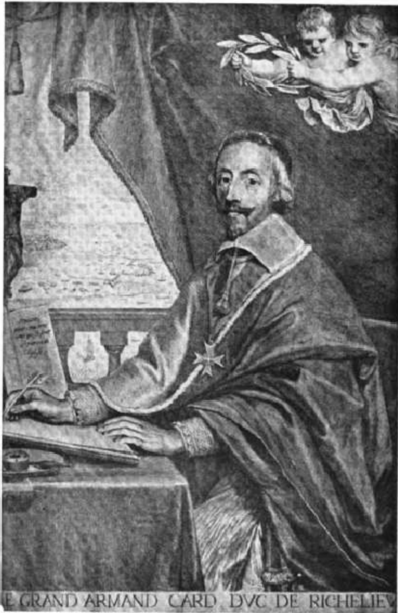
Frontispice du Traité pour convertir ceux qui se sont séparés de l'Eglise