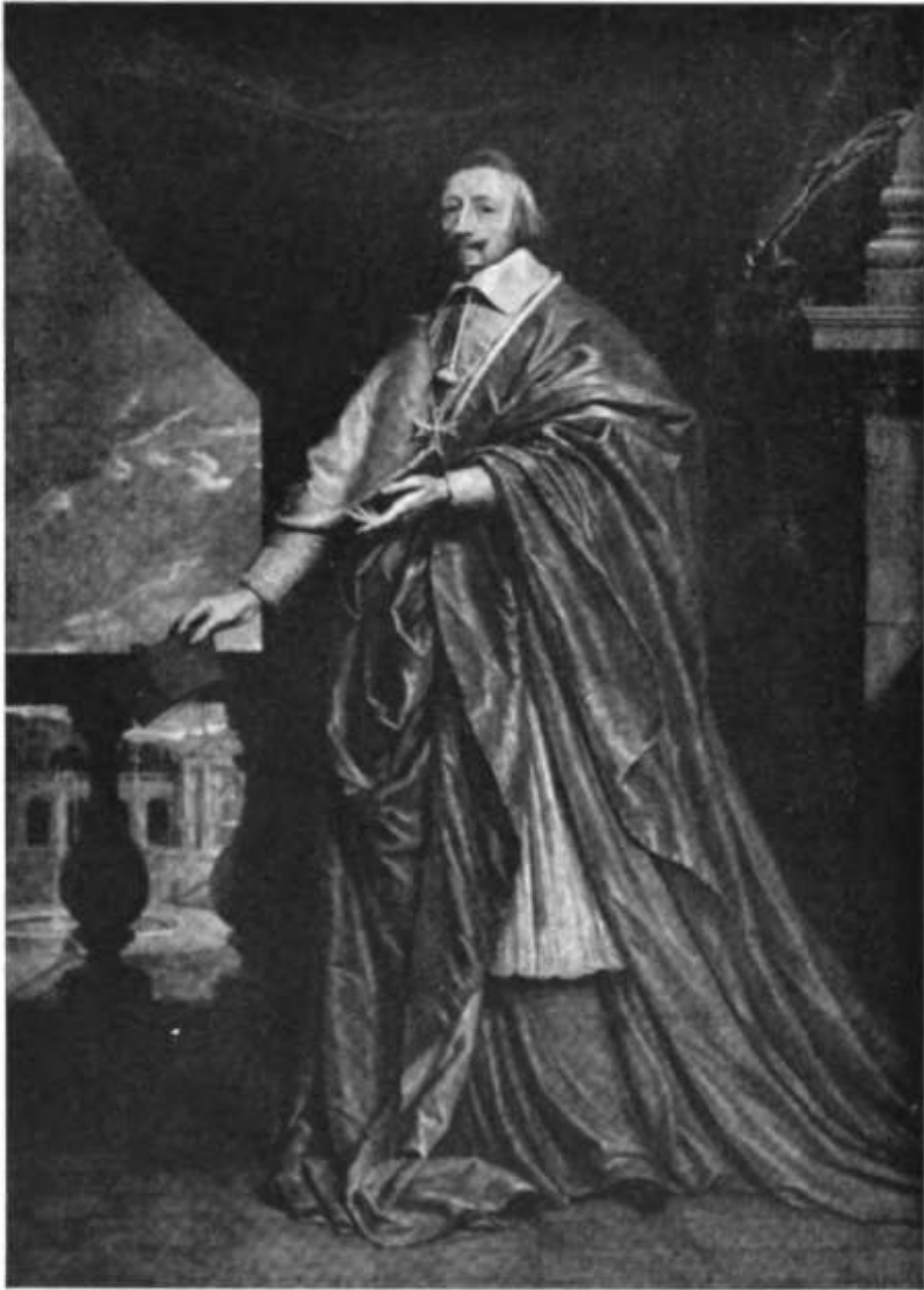
LE CARDINAL DE RICHELIEU d'après le portrait de Philippe de Champaigne conservé à la Sorbonne