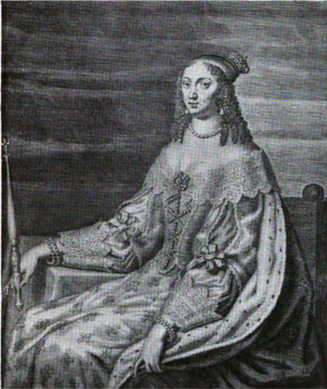
ANNE D'AUTRICHE Reine de France.