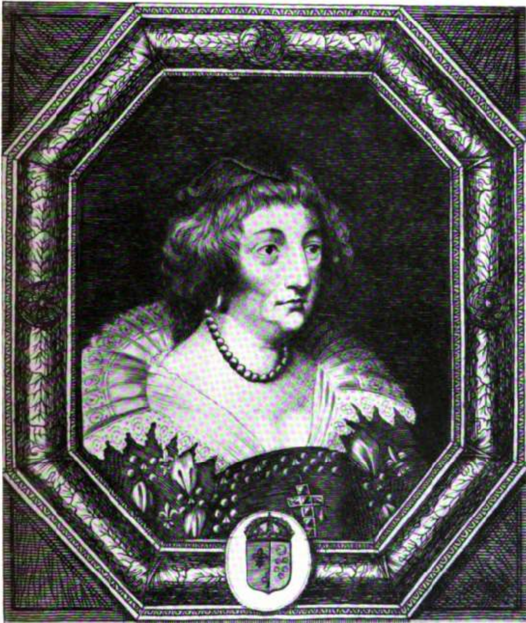
MARIE DE MÉDICIS, REINE DE FRANCE d'après une gravure de Moncornet.