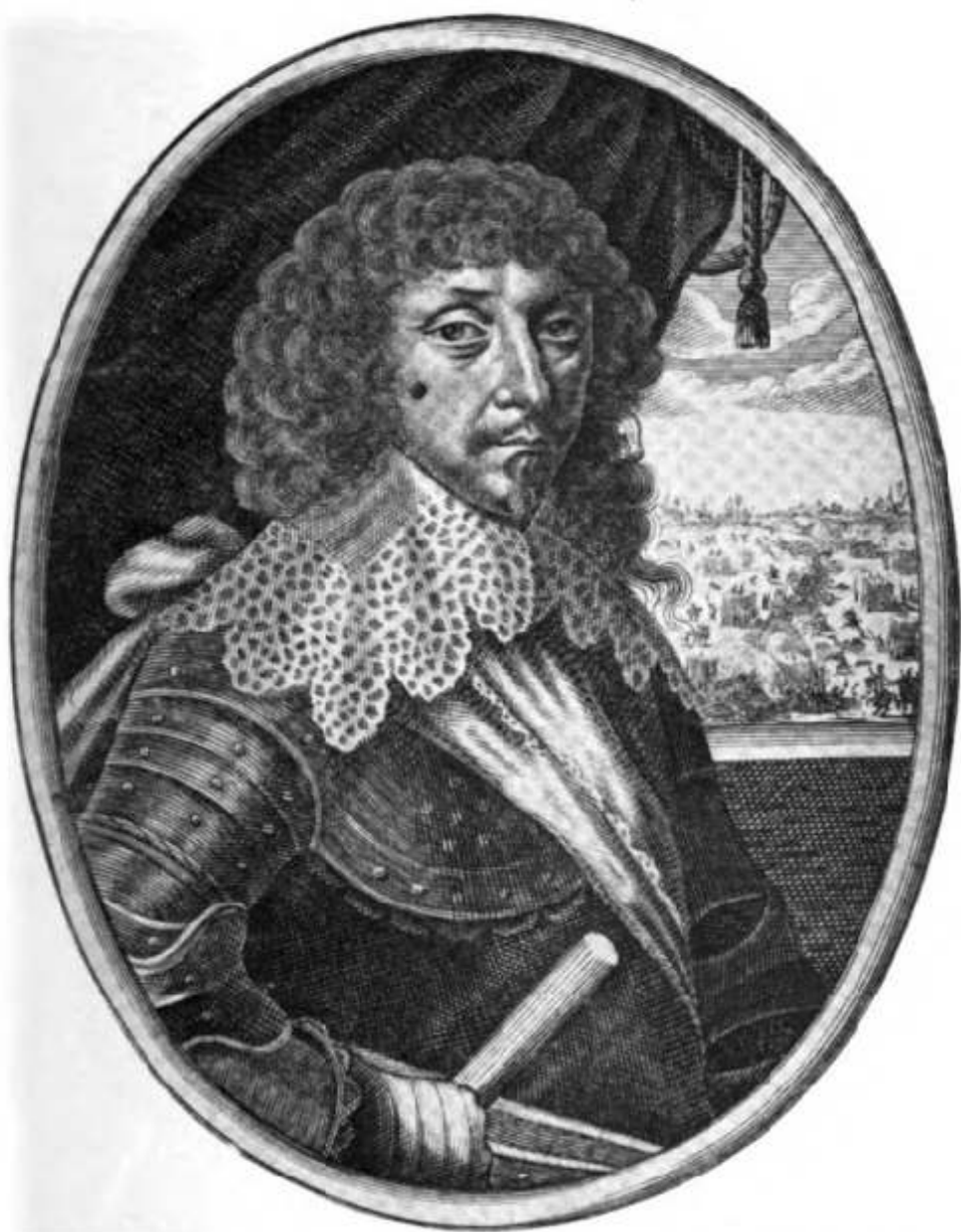
JEAN BVDES CONTE DE GVEBRIANT MARESCHAL DE FRANCE GENERAL DES ARMEE DV ROY EN ALLEMAGNE.