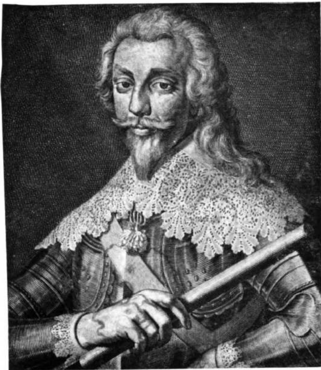
HENRI DE BOURBON PRINCE DE CONDÉ