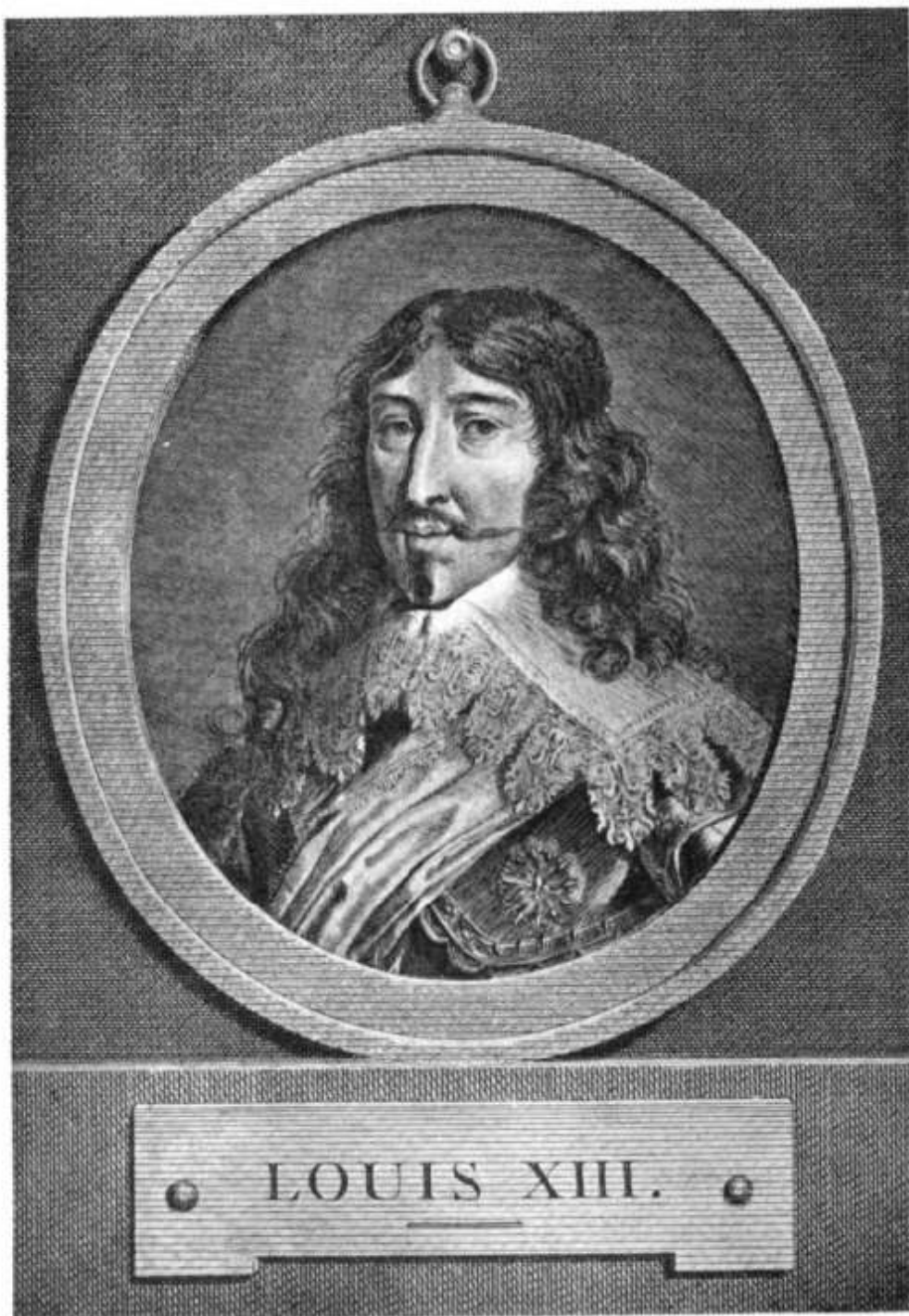
LOUIS XIII, ROI DE FRANCE