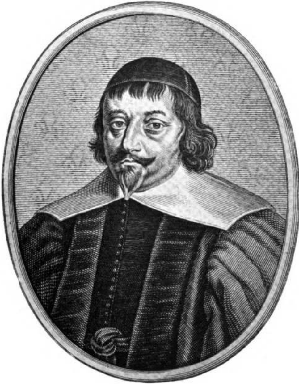
LAFEMAS • Le bourreau du Cardinal • d'après Michel Lasne.