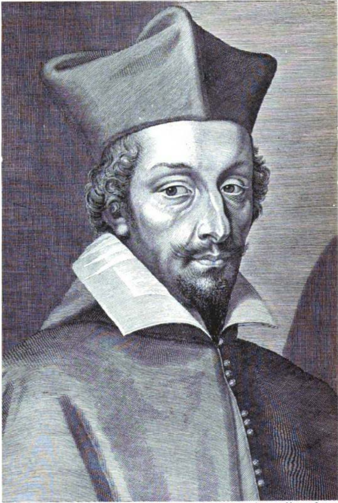
D'après MICHEL LASNE.